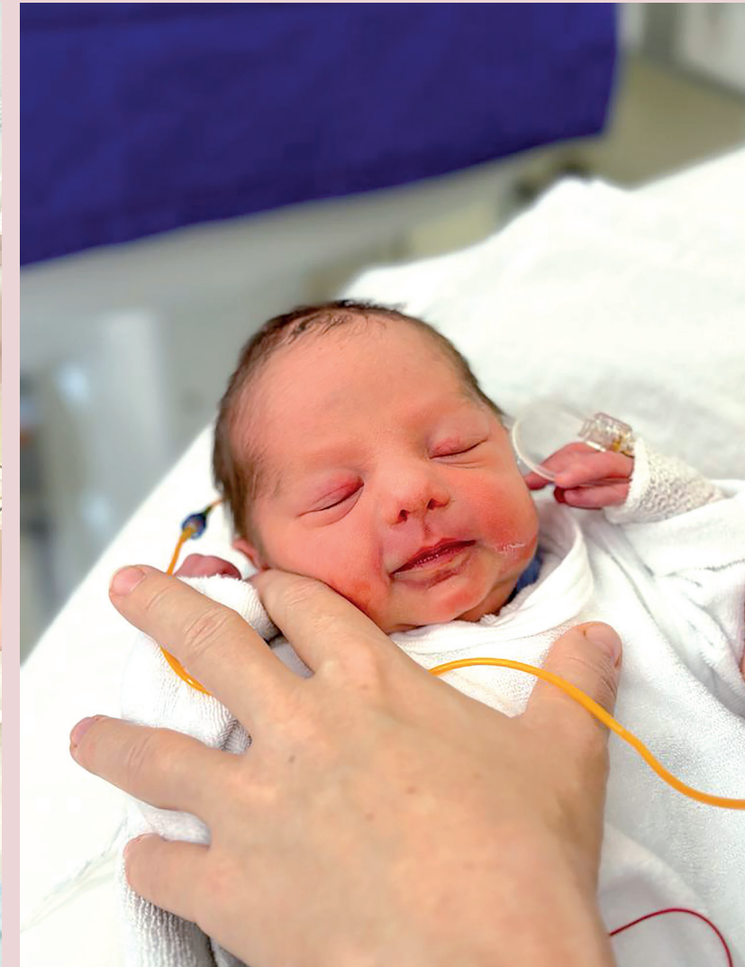
Erster Tag nach der Geburt