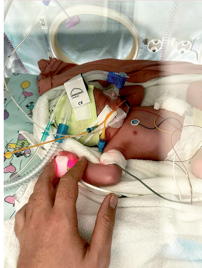
Tag der Geburt

Lesen Sie selbst! https://geburt.imketurau.de | In Kürze erscheint hier meine Kampagne "GLÜCKSKINDER" . Es bleibt spannend!